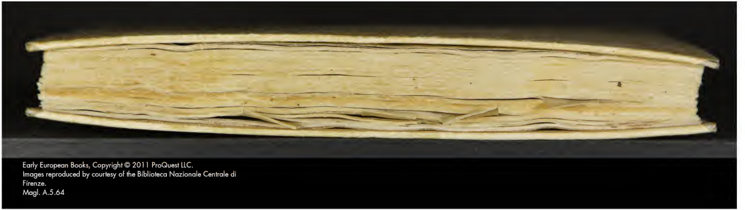
Magl. A.5.64